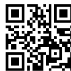
物語を届けるしごと ホームページ

自身のウェブサイト「物語を届けるしごと」は世界160か国以上からアクセスがあり、四国や瀬戸内の魅力を四国外や海外に発信している。