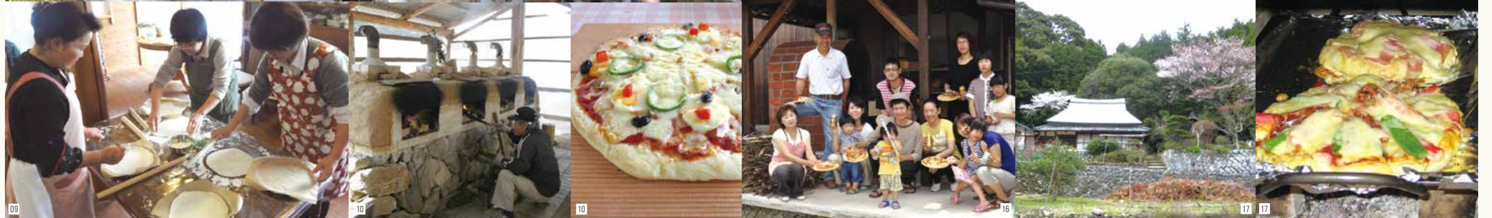
01 西条市丹原町川根の山あい、古民家を改装した「川根ハウス」でのピザ焼き体験。生地は米粉を使い、トッピングの野菜やベーコンは地元産にこだわっている。 02 希望により、ピザ窯を作るところから体験したり、ブルーベリーなどを使ったデザートピザを作ったりすることもできる。 03 観光りんご園の園内で、高原野菜を使ったオリジナルピザが楽しめる。りんご園が開園している9月～11月は、りんご狩りとセットにするのもOK! 04 「自宅の庭でピザ作りなどができるように」と、石窯を手作りされたご夫妻が体験を行っている。手作りのピザソースと地元産の旬の野菜で作るピザは格別。要望があれば、鯛の塩釜・焼きかぼちゃ・やさいもなども焼いたり、近くの農家さんのいちご狩り、みかん狩り、ジオガイドさんをご案内することもできる。 05 手作りの石窯のある庭から見える景色は、山と川が一体となった最高のロケーション!こだわりのトッピングを使ったピザ焼きや、こんやく作り体験が楽しめる。店主さんから久万高原の鮎や山のこと、いろいろな話を聞くこともできる。 06 自然に囲まれたログハウスで、季節野菜などを使い、石窯で焼く本格ピザ作りや石窯の中で煮込むポトフ作りが楽しめる。 07 ピザ焼き体験の中でも特に人気。道の駅「ふたみシーサイド公園」から車で7分。自然あふれる「はたるの里」と呼ばれる翠(みどり)地区にある。トッピングは5種類から選べ、石窯は4つあるので団体も大歓迎! 08 閉校校舎を利用してピザ作り体験の受け入れを行っています。地元産の食材などをトッピングして、石窯で焼き上げます。 09 ピザ生地を伸ばし、畑で採れた野菜や好きなものをトッピング。手作りの石窯で美味しいピザやパンが焼けます。自家製の味噌を使ったピザもおすすめ。 10 山間の静かなところに位置する築100年の古民家。手作りの石窯で、ピザ・アップルパイ・焼きりんご・焼きとうもろこし・鯛の塩釜み焼きなどが体験できる。